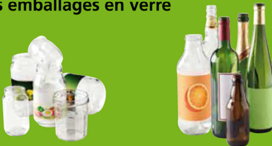
Pots, bocaux et bouteilles en verre