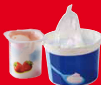
Pots de crème ou de yaourt