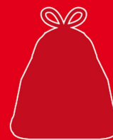
A mettre dans le bac pucé ou sac omologué SMIDOM