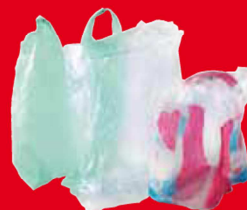
Sacs et suremballages en plastique