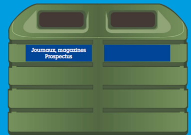
Papiers de bureaux