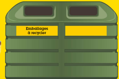
Boîtes et suremballages en carton